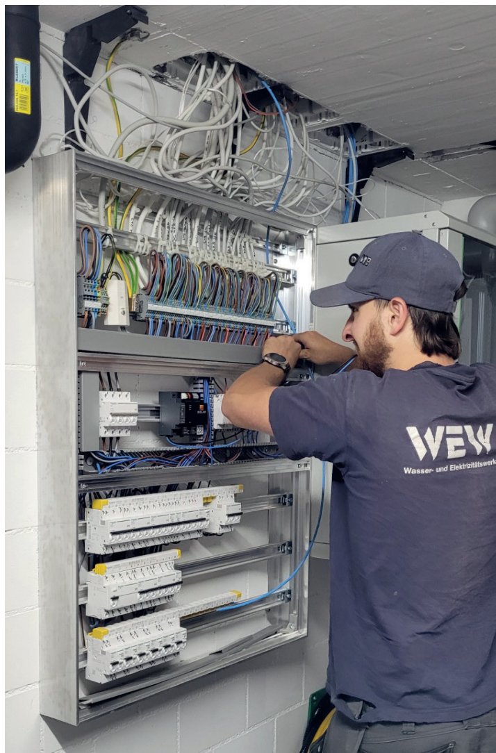
Installation des SolarManager.

Operative Datenoffenheit: Bereits in den ersten Sitzungen gewährte die WEW (unter NDA) einen tiefen Einblick in ihre Betriebsstrukturen, sowohl in administrativen Bereichen wie Buchhaltungsinformationen, Beschaffungsstrategien und Kostenauf-