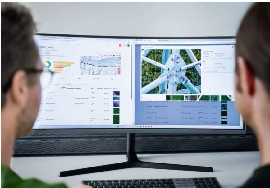
Bild 4 Darstellung und Analyse von Zustandsdaten.

abgestimmte End-to-End-Lösung. «Somit decken wir die gesamte Wertschöpfungskette ab. Dies macht uns auf dem globalen Energiemarkt einzigartig.»