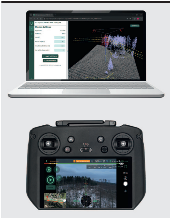
Bild 3 LINIApower für die Generierung von Flugmustern (oben); LINIAir Drohnensoftware für die automatisierte Datenaufnahme (unten).