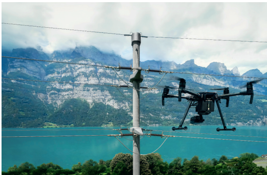
Bild 5 Einsatz einer Drohne am Walensee.