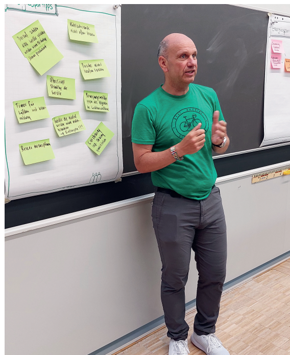
Impressionen aus einem der Workshops.

Bei den Workshops vom 25. Mai 2023 und 5. Juli 2023 wurden unter der Anleitung des ehemaligen Energieberaters Armin Meier Ideen und Massnahmen