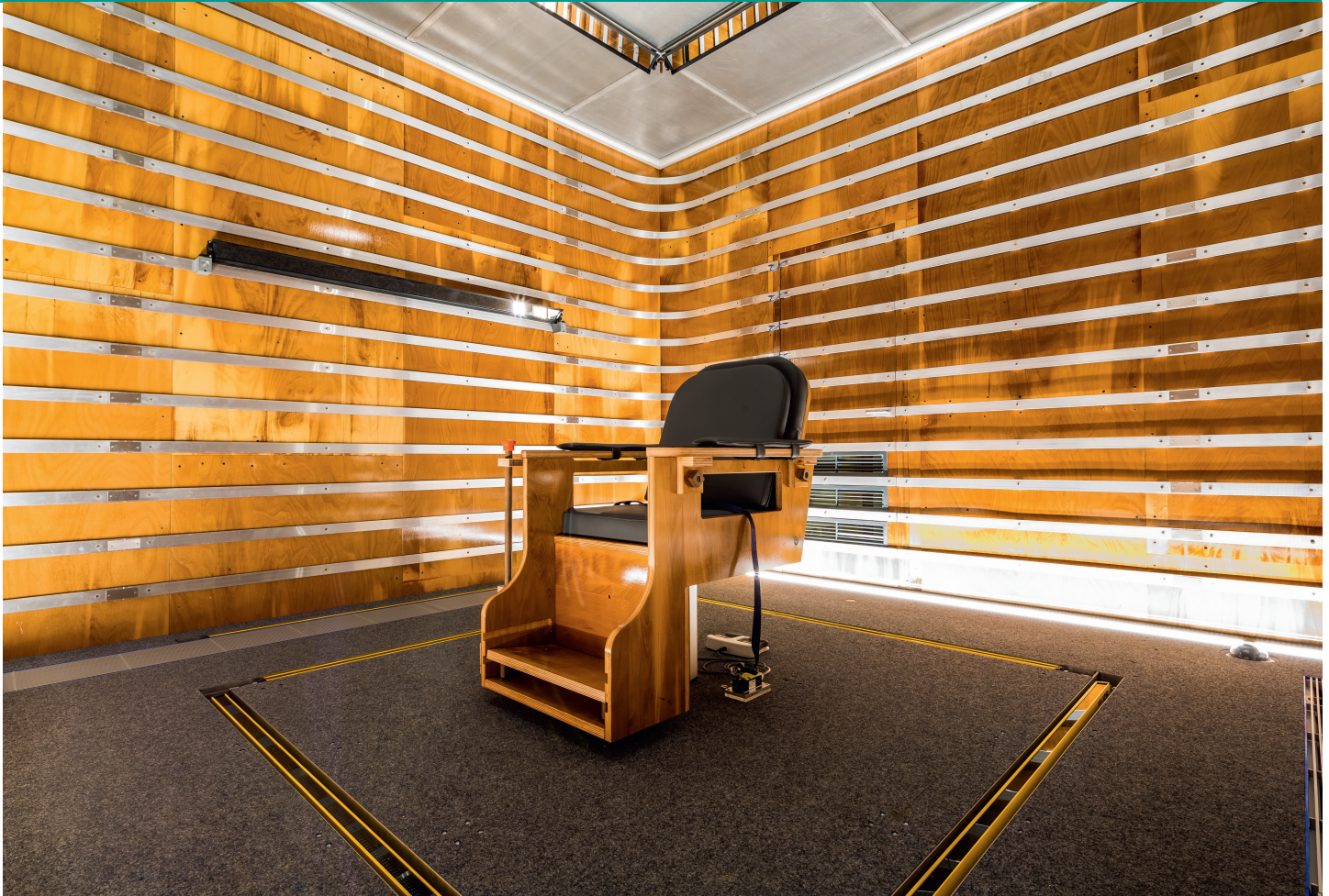
Salle d'essais du laboratoire d'exposition.