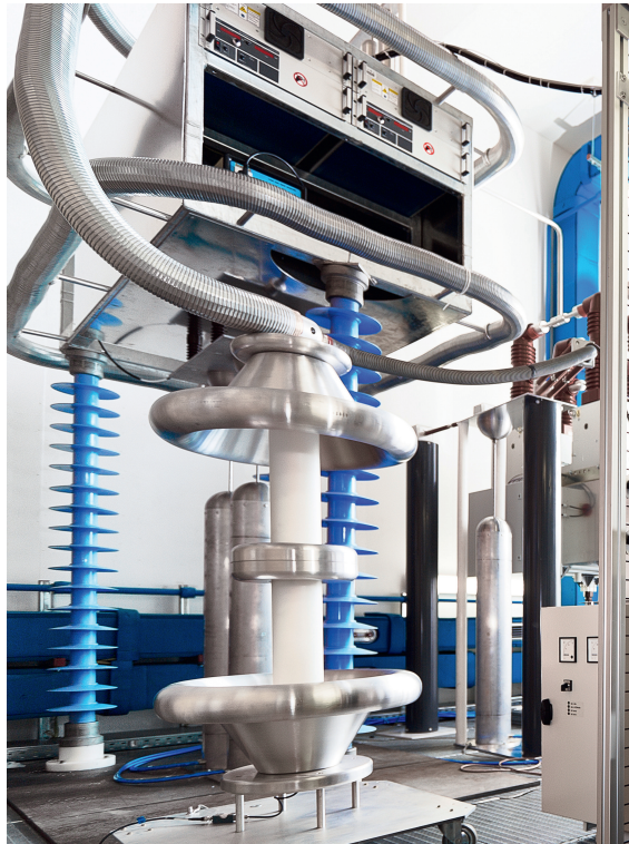
Figure 1 Technique haute tension du laboratoire d'exposition.

Pour étudier la perception de différents champs électriques, un laboratoire d'exposition a été construit sur le