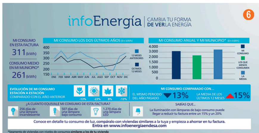
Bild 1 Der spanische Energieversorger Endesa bietet seinen Kunden auf der Stromrechnung eine Reihe von Vergleichsmöglichkeiten.

«Die Schweizer Energieversorgungsunternehmen beschränken sich bei ihren Stromrechnungen meistens auf