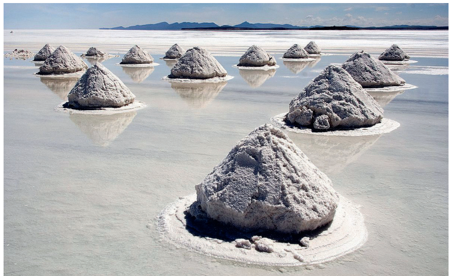
Der bolivianische Salar de Uyuni wird (noch) nicht für die Lithiumgewinnung genutzt.

es kommt etwas seltener vor als Zink und Kupfer, aber leicht häufiger als Zinn und Blei. Lithium wird heute hauptsächlich aus Salzseen gewonnen, in denen es meist als Lithiumchlorid gelöst ist. Dies geschieht vor allem in Chile (Atacama-Salzsee mit dem höchsten bekannten Lithiumgehalt von 0,16%), Argentinien, USA (Nevada) und China. Es gibt noch Salzseen, die nicht zum Abbau genutzt werden, beispielsweise der Salzsee Salar de Uyuni in Bolivien, der mit geschätzt 5,4 Mio. t Lithium eventuell über die grössten Vorkommen verfügt.