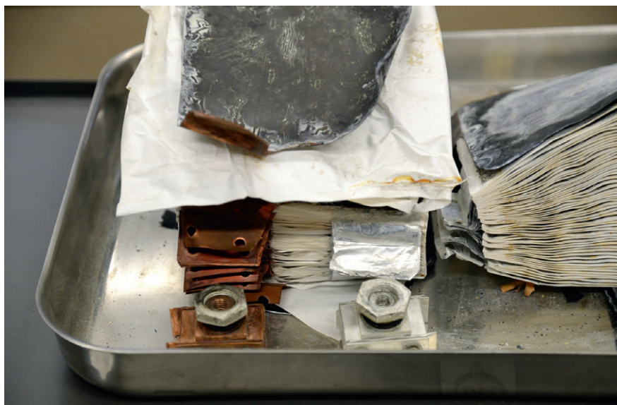
In Li-Ionen-Akkus hat es deutlich mehr Kupfer und Aluminium als Lithium.

gieintensiv. Ein Land müsste triftige Gründe haben (z.B. Versorgungsunabhängigkeit), um diesen Aufwand aufbringen zu wollen.