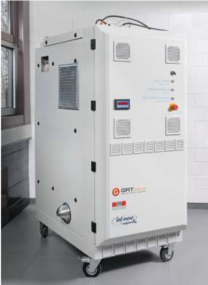
La machine Hyform-PEMFC dans le laboratoire de GRT Group.

Le problème est le suivant : l'hydrogène offre une teneur en énergie très faible en volume. Il s'ensuit des complications techniques pour le stockage et le transport (camions spécifiques), étapes nécessaires pour pouvoir apporter l'énergie à l'endroit du besoin. Pour le transport sous sa forme naturelle gazeuse, il exige des réservoirs à haute pression (350 à 700 bar) ou alors il peut être transformé en