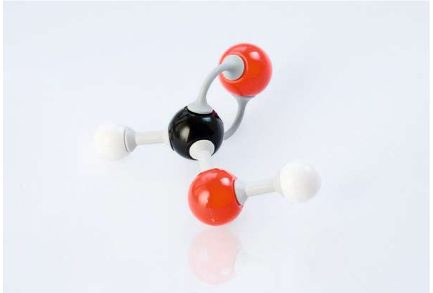
Représentation d'une molécule d'acide formique.

Le problème est le suivant : l'hydrogène offre une teneur en énergie très faible en volume. Il s'ensuit des complications techniques pour le stockage et le transport (camions spécifiques), étapes nécessaires pour pouvoir apporter l'énergie à l'endroit du besoin. Pour le transport sous sa forme naturelle gazeuse, il exige des réservoirs à haute pression (350 à 700 bar) ou alors il peut être transformé en