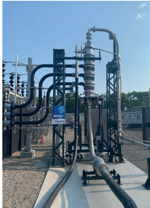
Projet de câble HTS aux États-Unis, à Chicago, dans l'État de l'Illinois.