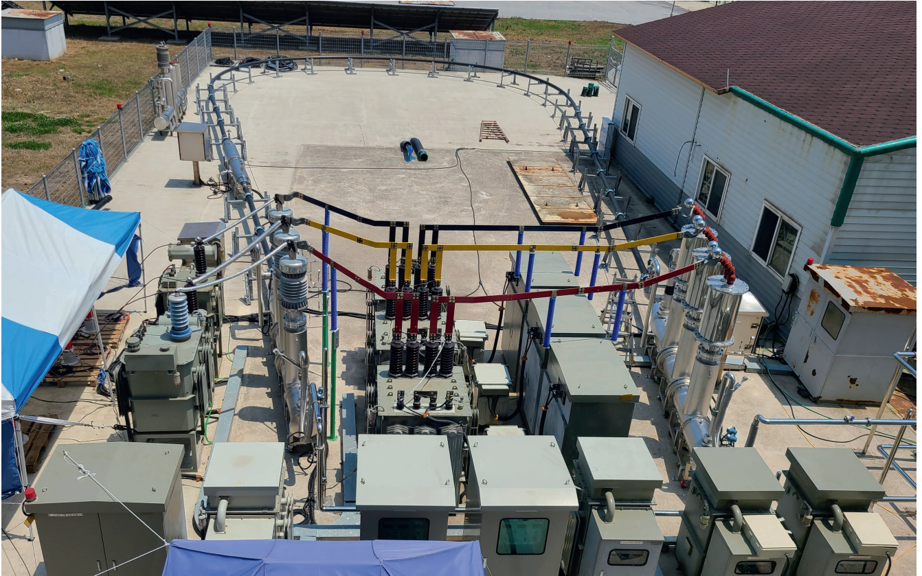
Test d'un câble HTS (23 kV, 60 MVA) dans le district de Gochang, en Corée du Sud.