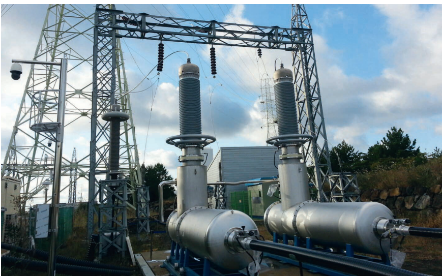
Extrémité d'un câble supraconducteur à courant continu avec une tension de 80 kV en Corée du Sud.

tipice (voir le premier encadré ) a évalué le niveau de développement des applications HTS pour le réseau électrique et les a rassemblées dans une « Application Readiness Map » (ARM). Ce document offre une vue d'ensemble du niveau de maturité technologique de différentes applications HTS. Les experts et expertes de l'industrie et de la recherche ayant participé au projet ont identifié trois domaines dans lesquels la technologie HTS a déjà atteint un haut niveau de maturité : parmi ceux-ci, les câbles moyenne tension performants pour alimenter les centres-villes, comme ceux utilisés à Essen, et qui sont également testés en Corée du Sud, en Chine et au Japon. « Les supraconducteurs peuvent transporter jusqu'à cinq fois plus d'électricité que les câbles traditionnels de même taille, ce qui en fait une solution relativement bon marché pour l'approvisionnement des zones urbaines dont les besoins en électricité sont en constante augmentation », explique le professeur Carmine Senatore (Université de Genève), qui représente la Suisse au sein du comité d'experts de l'AIE.