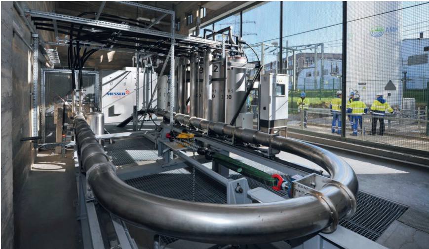
Câble supraconducteur de 10 kV utilisé d'avril 2014 à mars 2021 dans le centre-ville d'Essen. Le réservoir d'azote se trouve à droite, à l'extérieur du bâtiment.