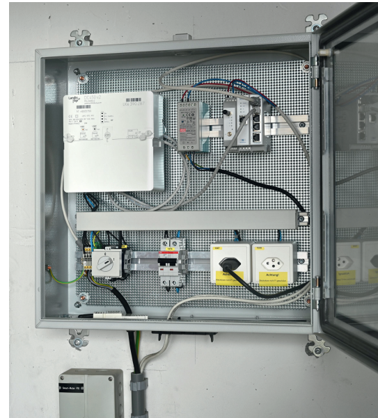
Der Datenkonzentrator sammelt die Zählerdaten und leitet sie weiter an das Rechenzentrum.