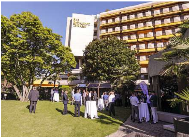
La pause café à l'extérieur du Royal Plaza.