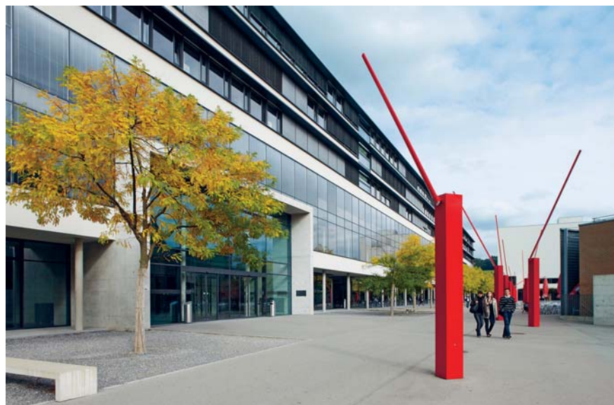
Figure 3 L'iimt à l'Université de Fribourg.

Avec ce concept, les membres altruistes ont la possibilité de fournir à des voisins de l'électricité spécifique. D'autre part, les membres égoïstes profitent également de la structure, puisqu'ils ne doivent pas, ou peu, payer de contributions de solidarité pour l'expansion du réseau. Il est également probable que la fusion des cellules iGSL dans une Crowd