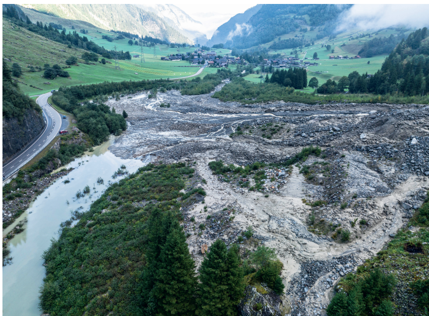
Ablagerungsraum im Tal in der Aare oberhalb Guttannen.

Die KWO rechnet damit, dass der Rotlouwibach laufend mit Material gespiessen wird, das Murgänge auslösen kann.