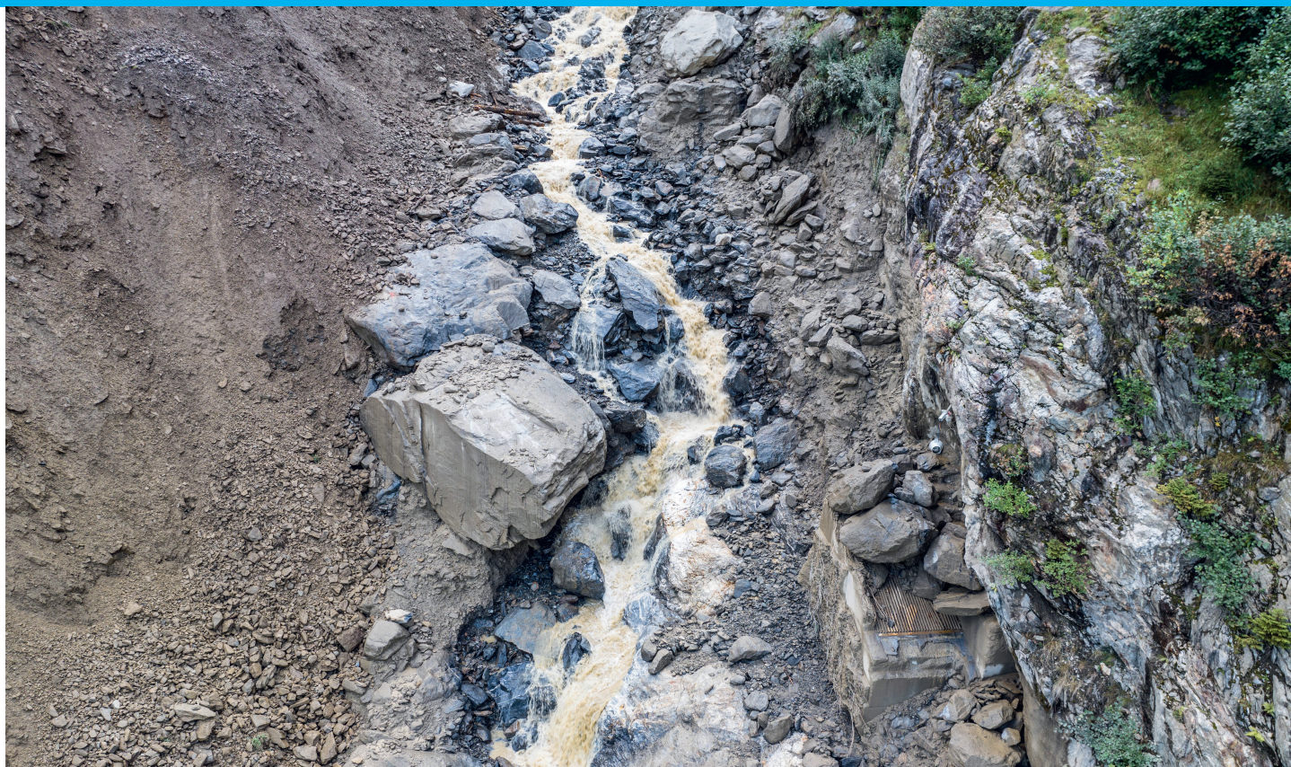
Zustand Fassung (Tirolerwehr) nach dem Murgang im August 2023.